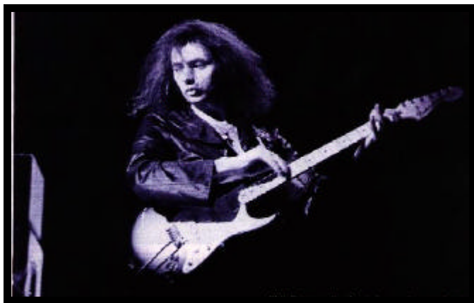
Ritchie Blackmore in concerto

che era stanco di produrre dischi da solo con i suoi Rainbow, e voleva di nuovo diventare un chitarrista di una band e non sotto l'etichetta di un singolo. Nasce così nel 1984, dopo 8 anni dall'ultimo disco della band e dopo quasi 11 anni dall'ultimo disco della Mark 2 un nuovo album, Perfect Strangers (ottobre 1984) che riuscì grazie alla sua essenza musicale ed alla sua sostanziale semplicità a ricattare sia i fans che l'attenzione della critica. I pezzi dell'album furono quasi tutti composti da Blackmore il quale con la sua chitarra fa gran parte dell'album anche dal punto di vista musicale. I pezzi più belli dell'album sono sicuramente, Perfect Strangers , Knocking at your back door , A Gypsy's Kiss , i quali contengono riff micidiali difficili da dimenticare e degli ottimi assoli di chitarra tra i quali forse il più bello è quello del lento "Wasted Sunsets". Nella versione remix dell'album vi sono anche due bonus tracks: Not Responsible o Son Of Alerik. Parte così il primo tour mondiale che comincia in Australia. Nel secondo concerto del quale si ha un bottleg, registrato ad Adelaide il 30 novembre del 1984, i Purple sono molto tesi, cosa naturale, in quanto non facevano concerti insieme da più di 10 anni. Vengono qui proposti brani del nuovo album, e grandi classici quali Highway Star, Strange Kind of Woman, Lazy, Space Truckin. Da ricordare in questo concerto un simpatico