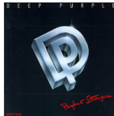
Perfect Strangers (1984)